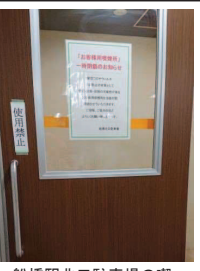
船橋駅北口駐車場の喫煙室一時閉鎖の掲示 19時より開催。メールリストなどでご案内しますので皆様もぜひご参加下さい。(紅谷)

8月20日(木)は9名が参加し、千葉県議会の喫煙室新設への対応や秋のエコメッセごちぼのオンライン出展などについて話し合いました。WEBミーティングはどこからでも参加できる事もあって、県外の方も含めて3名が初参加でした。