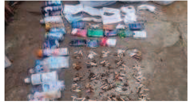
回収されたゴミ: タバコ420本、タバコ箱13箱マスク9枚、アルミ缶10缶、PB10本、ビン1、可燃ゴミ約1000g、レジ袋8枚

喫煙が健全な人間生活に害のあるものと分かった以上、喫煙する姿や、吸い殻を含めタバコとその箱を、特に未成年者の目に日常的に触れないようにすることは健康教育上、基本的な重要事項だ。ポイ捨てされた吸い殻を清掃することの本当の意義はここにある。